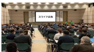
スライド広告イメージ

スクリーン広告を、主催者作成の各種案内と共に各発表会場の幕間時間に上映します。 2026年10月22日(木)～23日(金) 第37回全国介護老人保健施設大会 栃木 開催時 プログラム開始前および幕間